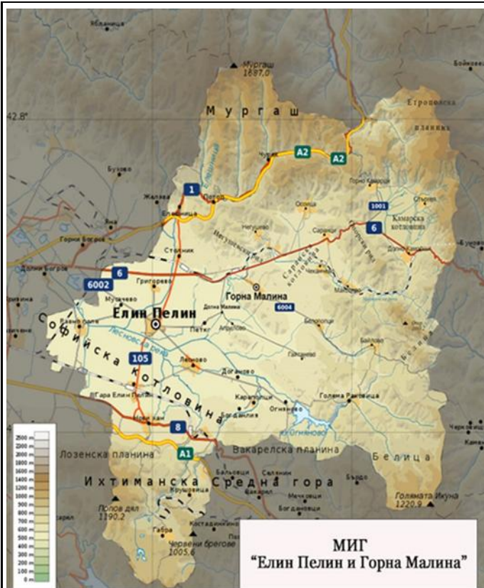
Фигура 1. Карта на територията на МИГ „Елин Пелин - Горна Малина“

Територията на МИГ „Елин Пелин – Горна Малина“ е част от Югозападен район за планиране (NUTS 2), разположена в централната част на Софийска област. Територията на МИГ има обща площ от 769,3 km 2 , общ брой население по данни на НСИ към 2020 г. - 31 106 души и се състои от общо 33 населени места. От тези 33 населени места, 19 от попадат на територията на община Елин Пелин - административен център - град Елин Пелин и 18 села, а останалите 14 попадат на територията на община Горна Малина - административен център - село Горна Малина и още 13 села.